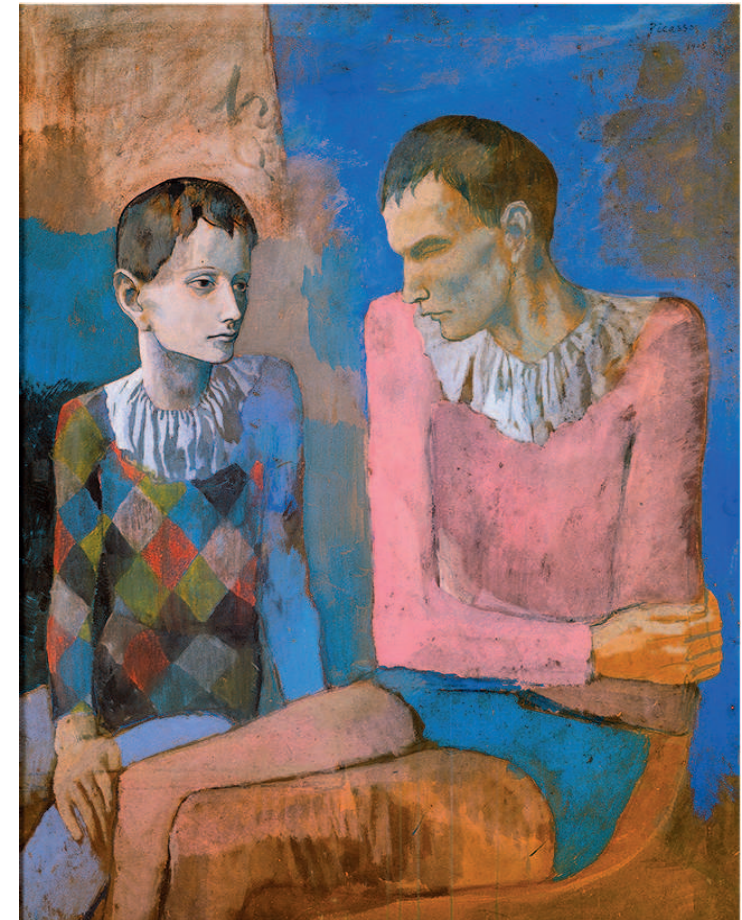
Pablo Picasso, Acrobate et Jeune Arlequin, 1905 © Succession Picasso 2018, ProLitteris, Zürich